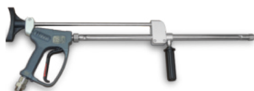
GC 1100 waterblasting spray gun with lance Pistola con lancia per waterblasting GC 1100