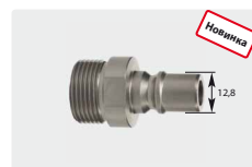
Штекер : AG. Нерж. сталь. Max. 350 bar / 100 °C