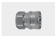
Муфта : IG. Нерж. сталь V2A. Макс. 350 bar / 100 °C