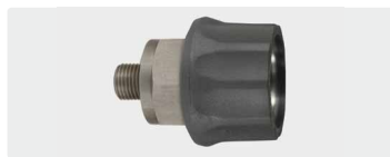
Муфта : AG. Нерж. сталь. Макс. 600 bar / 150 °C