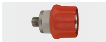
Муфта : AG. Нерж. сталь. Макс. 600 bar / 150 °C