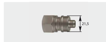
Штекер : IG. Закаленная нержавеющая сталь. Макс. 600 bar / 150 °C