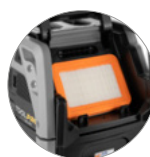
Плоский фильтр PTFE