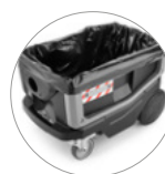
Фильтр-мешок из PE (опция)