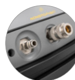
Комплект COMBI (опционально)