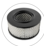
Картриджный фильтр HEPA